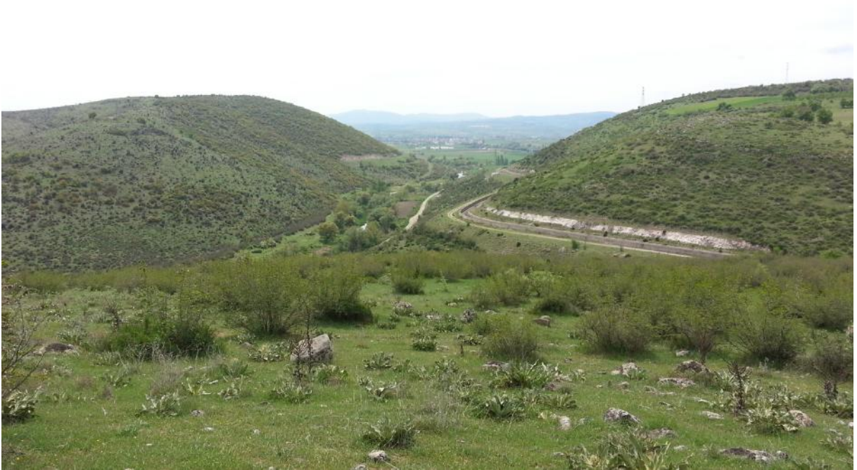
Burgaz Boğaz ı ve arka planda Pamukçu Ovas ı