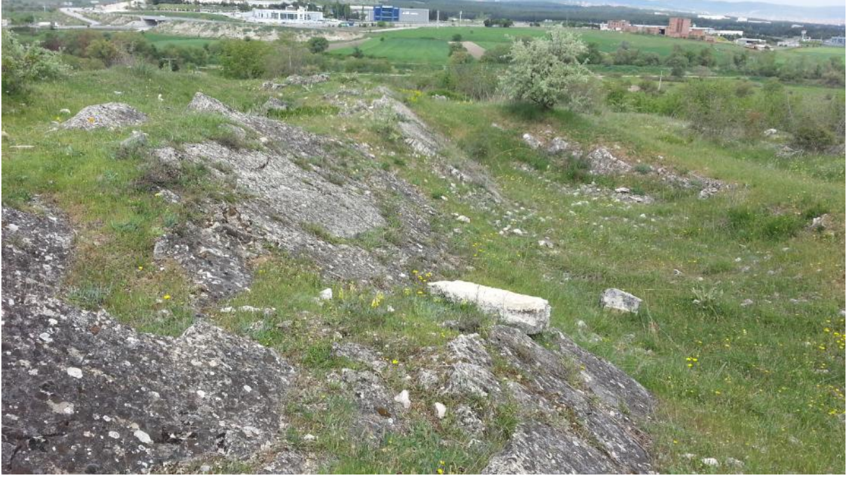
Balıktaş ırtında monoklinal yapı oluřturmuş kireçtaşı tabakaları