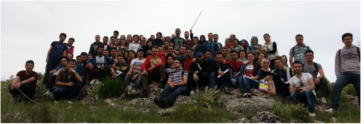
Arazi alıřmasına katılanlar Burgaz Tepe' de