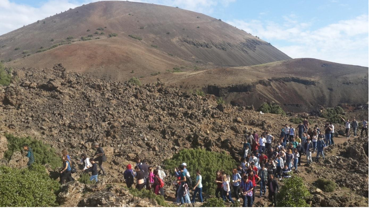
Foto 3. Kula Divliti karşısında bulunan lav akıntılarında oluşturulan parkurdan geçerken