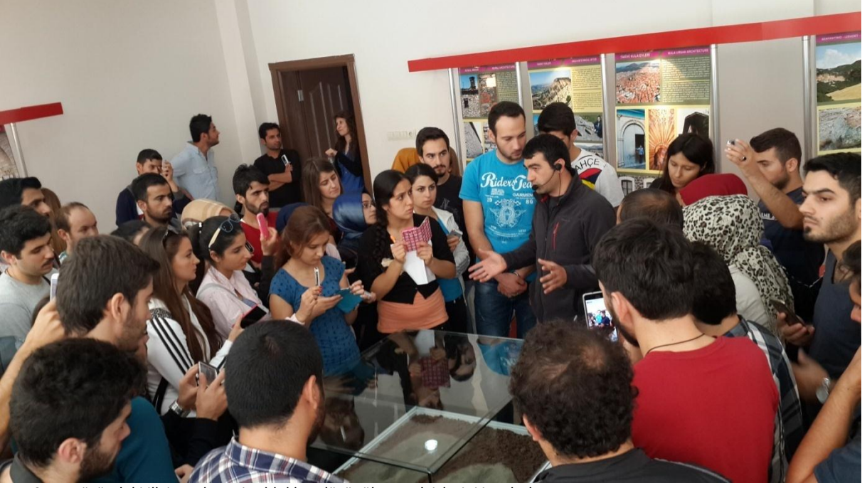
Foto 2. Yeryüzündeki ilk insanlara ait oldukları düşünölen ayak izlerini incelerken.